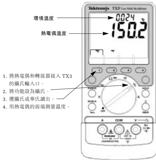
熱電偶香蕉型 插頭轉接器